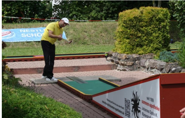
Lärmschutzwandwerbung & Bahnenwerbung