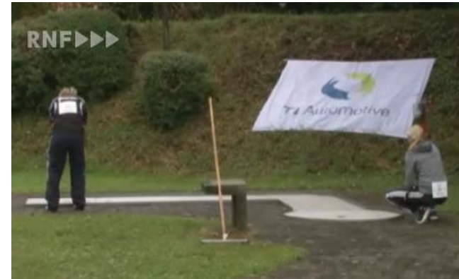
Werbung auf dem Lärmschutzhang