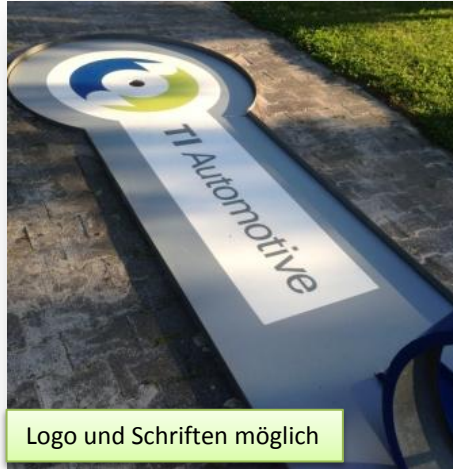
Logo und Schriften möglich